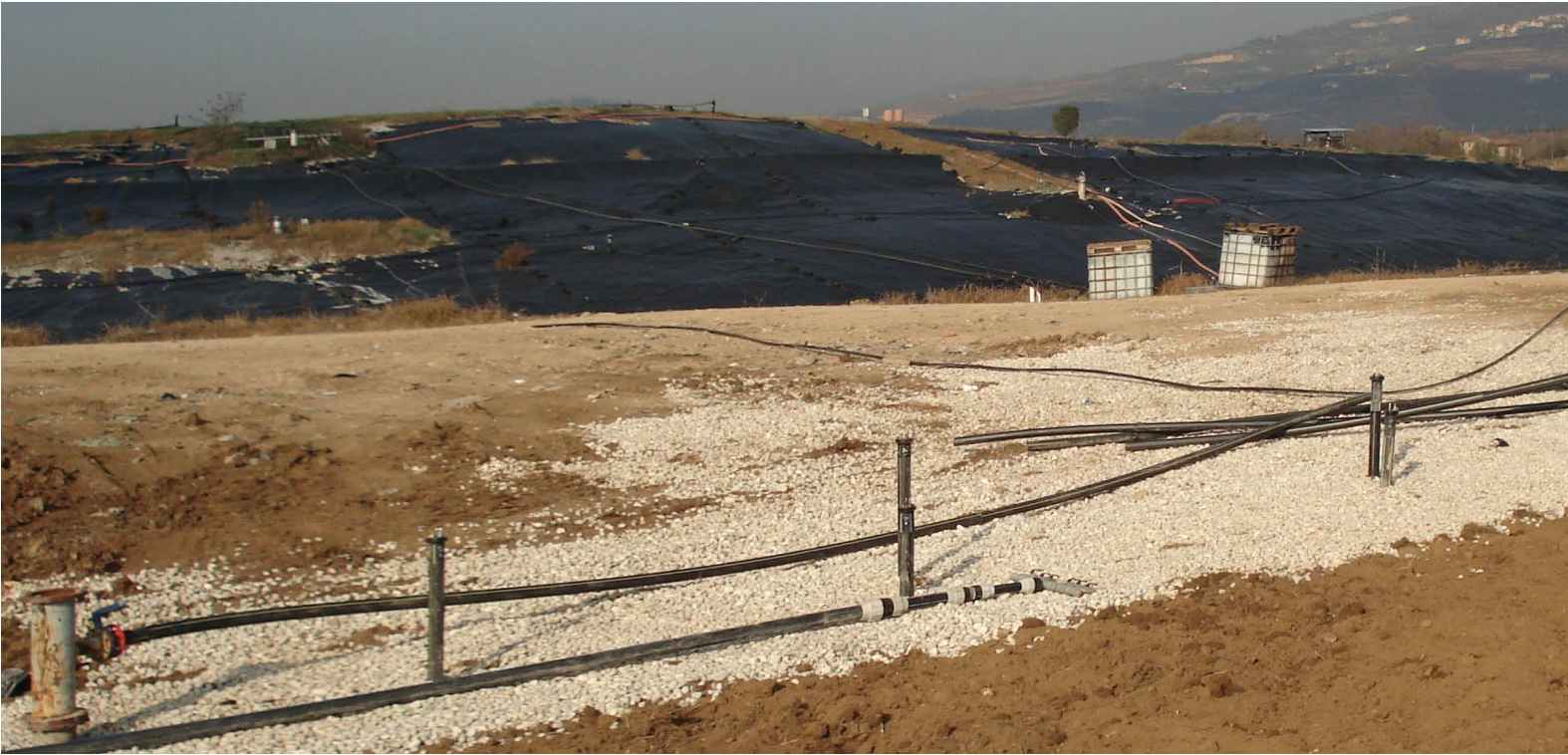
figura 1: discarica di Pescantina, Verona - campo prove figure 1: Pescantina Landfill, Verona, Italy - in situ tests