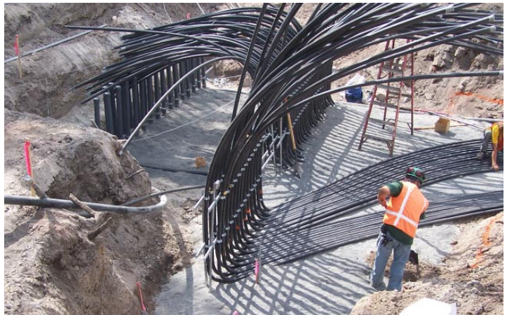
figura 8: intervento di bioventing figure 8: bioventing intervention