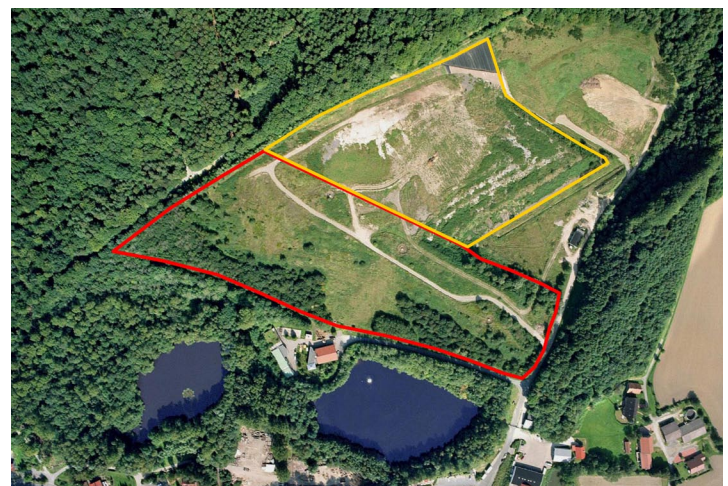
figura 6: ex discarica di Dörentrup, Germania figure 6: old Dörentrup landfill, Germany

Attualmente, in Germania, sono in corso interventi di stabilizzazione dei rifiuti con aerazione in situ a bassa pressione nelle discariche di Dörentrup (figura 6) e Halberbracht in Vestfalia, di Süplingen in Sassonia e di Schwalbach-Griesborn in Saarland.