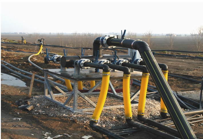
figura 5: sottostazioni nella ex discarica di Legnago figure 5: substation installed on old Legnago landfill, Italy

In tutti questi casi, l'applicazione del sistema Airflow ha dato degli ottimi risultati, permettendo di incrementare il grado di stabilità dei rifiuti depositati e, dove previsto, garantendo condizioni di sicurezza durante le operazioni di scavo e Landfill Mining .