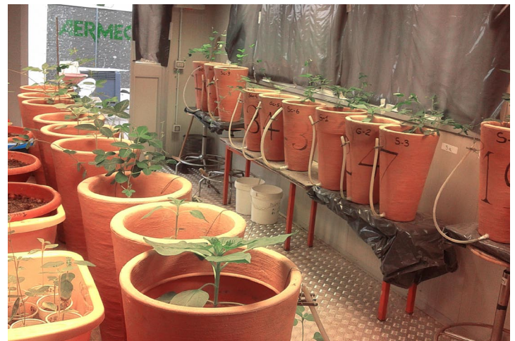
figura 12: girasoli irrigati con percolato figure 12: irrigation of sunflowers with landfill leachate

Il biodiesel può essere prodotto da una varietà di materie