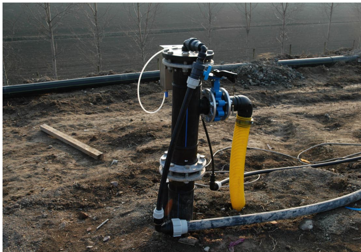
figura 3: particolare della testa di pozzo figure 3: detail of aeration well

Nel caso si riscontrino elevati battenti di percolato in discarica, può essere installato un sistema di emungimento costituito da pompe pneumatiche posizionate all'interno dei pozzi