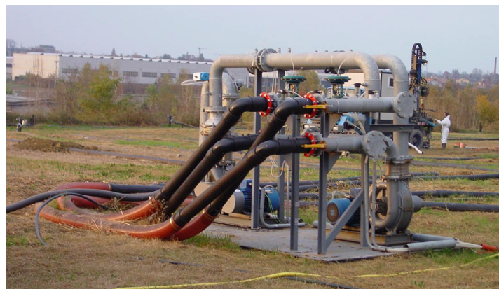
ex discarica di Campodarsego (PD)

Realizzazione di un intervento di aerazione in situ con sistema Airflow presso la discarica di Campodarsego (PD).