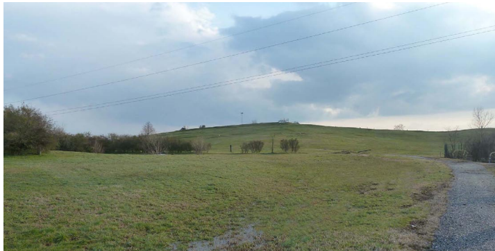
ex discarica di Ciliverghe (BS)

Esecuzione di indagini specialistiche presso la discarica di Ciliverghe, Mazzano (BS) finalizzate alla determinazione dei parametri sito-specifici necessari all'applicazione del sistema Airflow .