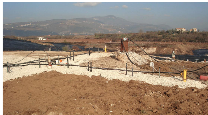
discarica di Ca' Filissine di Pescantina (VR) - campo prove

Esecuzione di una campagna di indagini preliminari in situ necessarie alla caratterizzazione della discarica Ca' Filissine di Pescantina (VR) e valutazione dell'applicabilità del sistema Airflow per la bonifica della discarica.