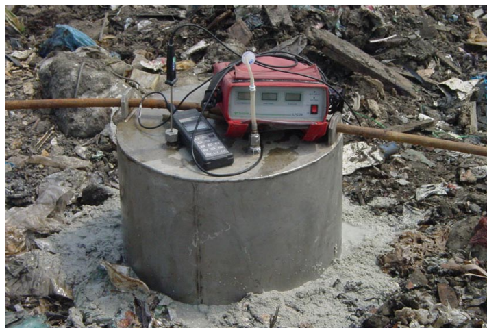
figura 10: pozzo ispezionabile per il monitoraggio dei gas figure 10: monitoring well for pressure and gas composition analysis