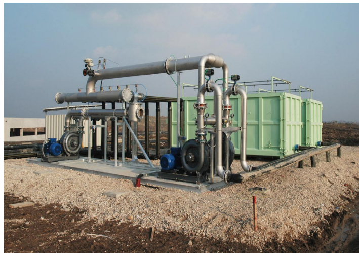
figura 4: centrale di insufflazione/aspirazione, ex discarica di Legnago figure 4: injection/extraction station, old Legnago landfill, Italy

di aerazione, in modo da migliorare la propagazione dell'aria nel corpo discarica e ridurre la presenza di falde sospese.