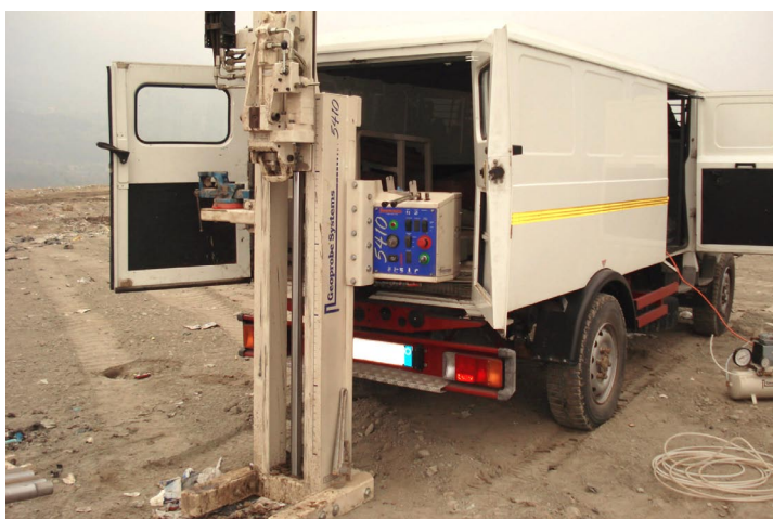
figura 9: sonda Geoprobe montata su veicolo fuori strada figure 9: Geoprobe equipment

Spinoff srl provides a large number of services concerning the characterization of landfills and contaminated sites, such as planning, coordination, investigation, risk analysis and scientific consulting.