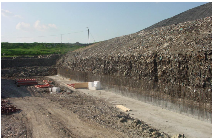
figura 7: intervento di bonifica con rimozione dei rifiuti e recupero dei materiali ( Landfill Mining ) figure 7: remediation through waste removal and material recovery ( Landfill Mining )